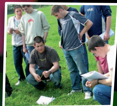
le choix de l'alternance